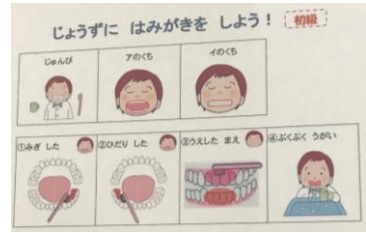
カード み ひとり カードを見て一人でできる手順表