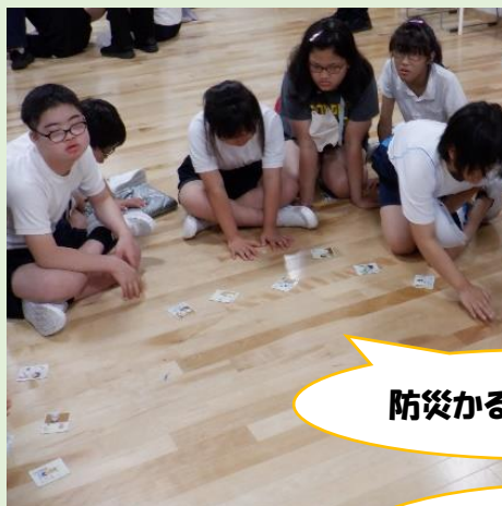
防災かるたをしました