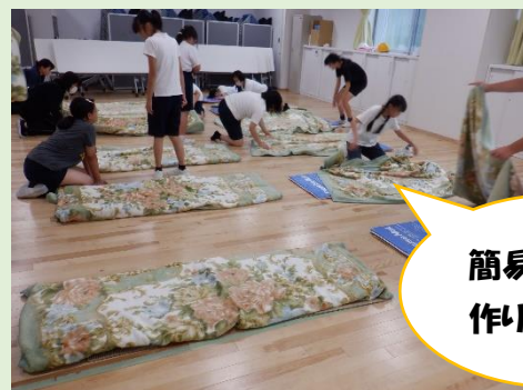
簡易ベッドを作りました