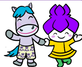
水元特別支援学校キャラクター ぼにたん&みずもちゃん